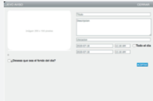
→ Ilustración 10