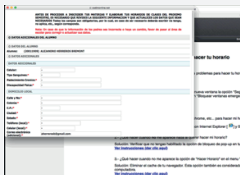
→ Ilustración 7

Una vez consultada la fecha y la hora en la que le corresponde realizar su horario de clases, deberá ingresar al portal Roadmap y posteriormente ingresar al sub-menú Hacer Horario, al pulsar esta opción deberá aparecer una ventana emergente en la que se muestra de inicio la información del estudiante (nombre, matrícula, dirección, etc). Pulsamos aceptar a esta ventana y comenzaremos a realizar la selección de las materias deseadas y pulsamos el botón de inscribir.