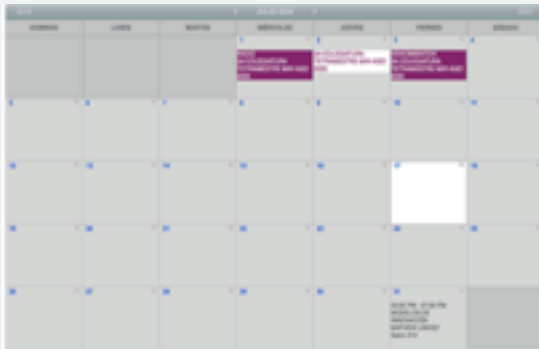
→ Ilustración 10

El profesor que impartió cada clase, así como todo el detalle de las materias a las cuales se ha inscrito el estudiante.